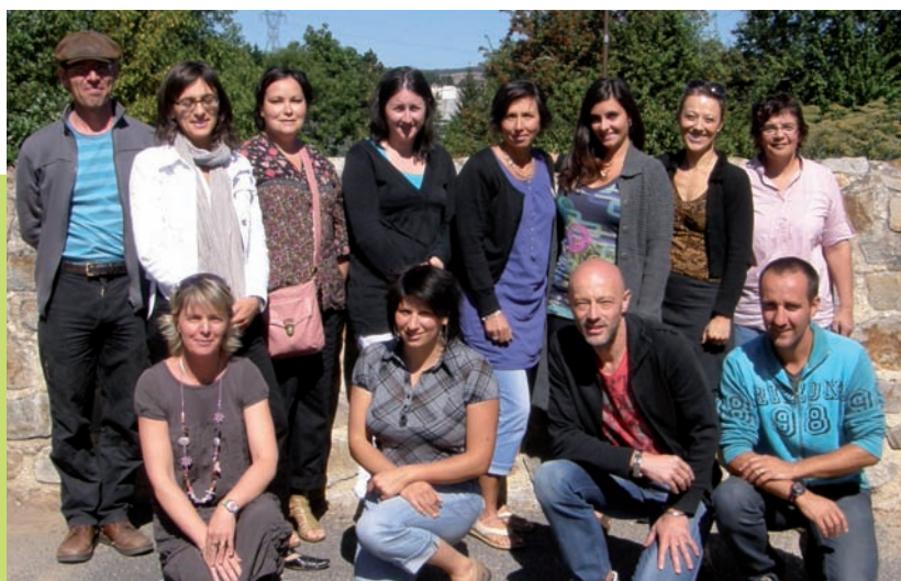
L'équipe enseignante de l'école publique

Le jeudi 2 septembre 2010, les enfants de BEAUZAC, âgés de 2 à 10 ans ont repris le chemin de l'école. Cette année, une petite nouveauté dans les écoles : un tableau numérique interactif est à la disposition des maîtres et des élèves.