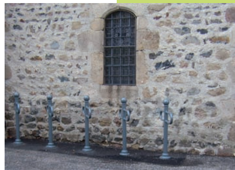
Parking à vélos

Nous rappelons à cette occasion que le stationnement « sauvage » sur cette place ne fera que pénaliser la circulation (voitures comme personnes à mobilité réduite, médecins et services de secours...). Le civisme de chacun fera le bonheur de tous. C'est, en tout cas, notre objectif.