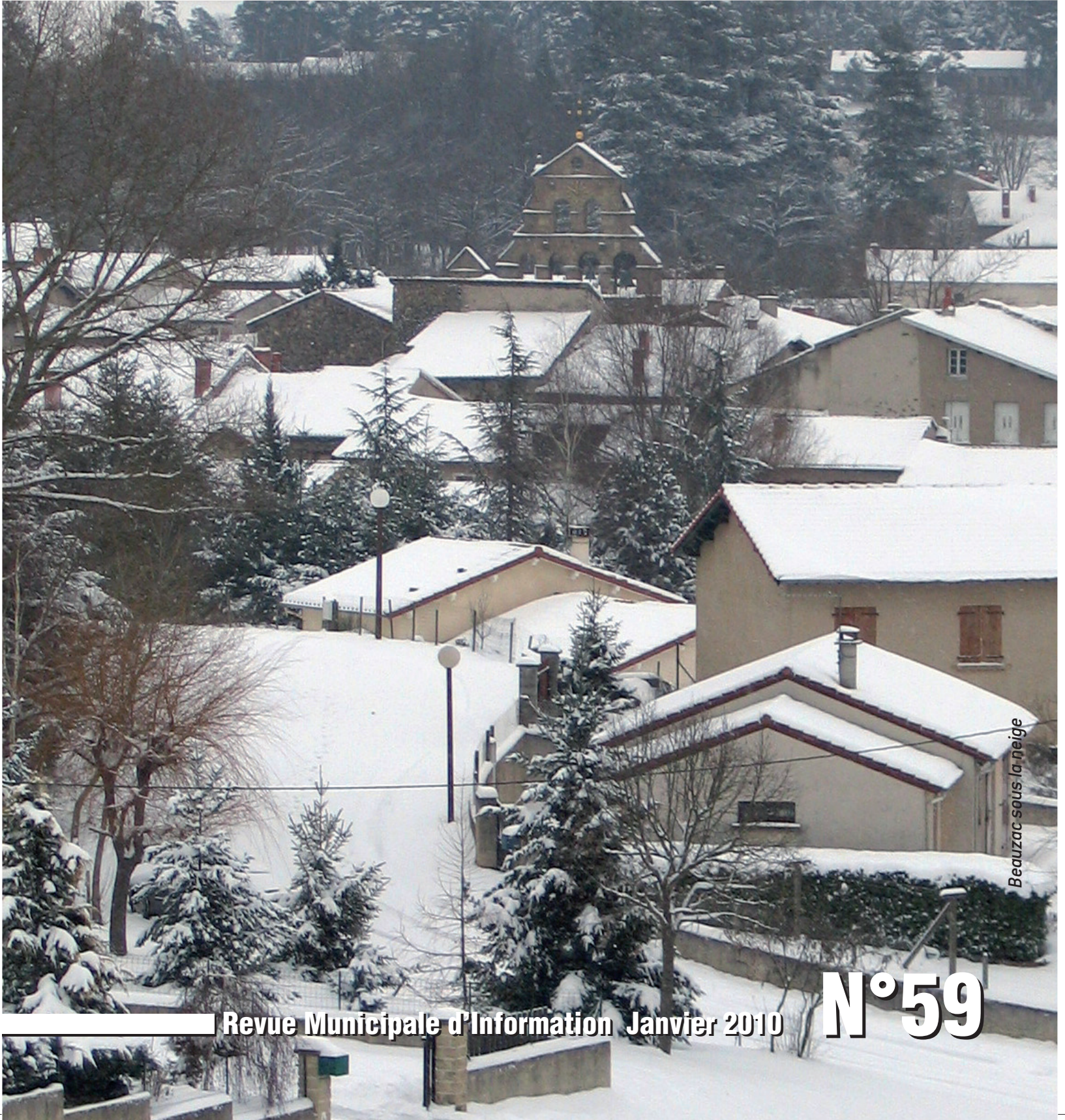
Beauzac sous la neige

www.ville-beauzac.fr e-mail: mairie@ville-beauzac.fr