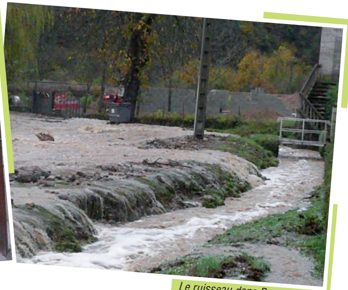
Le ruisseau dans Bransac Haut