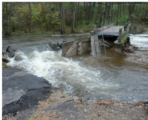
le pont de Bérard a été très endommagé

Seul le pont du Ramel, submersible, mais obstrué, a tenu.