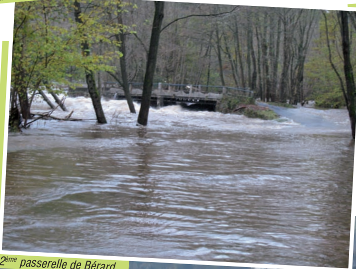
2 ème passerelle de Bérard