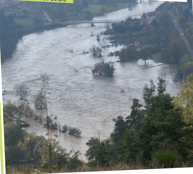
Vaures - Bransac