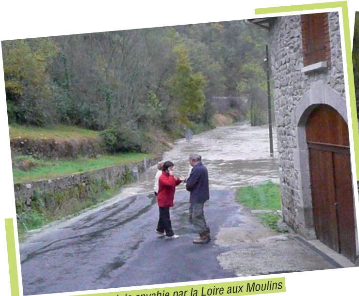
La route départementale envahie par la Loire aux Moulins