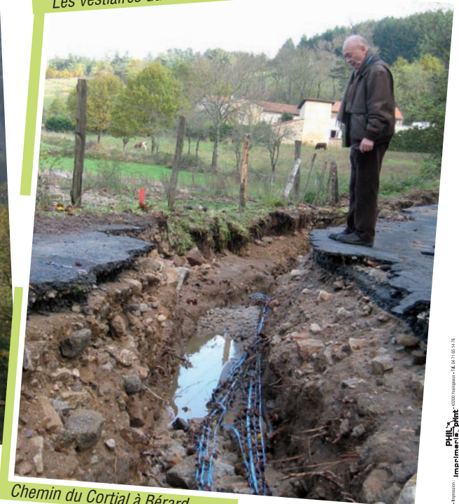
Chemin du Cortial à Bérard