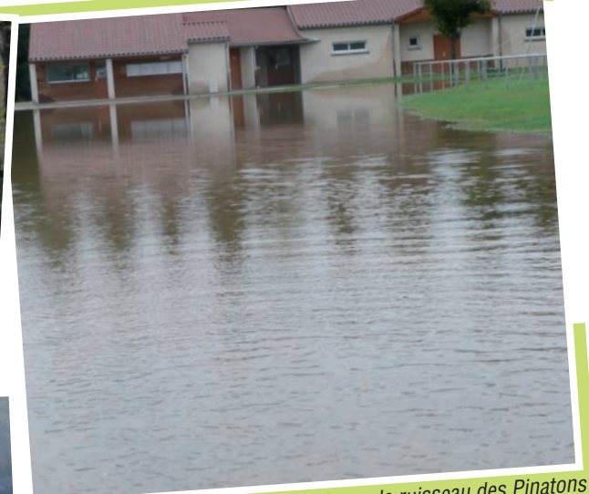
Les vestiaires du foot inondés par le ruisseau des Pinatons