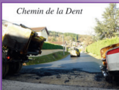
Chemin de la Dent