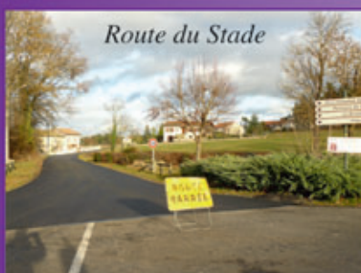
Route du Stade

Le programme de voirie 2018 sur les secteurs de Combres, Arthaud, Chemin de la Dent, les Préaux, les Rioux est terminé. Ces travaux ont été réalisés par l'entreprise Eiffage. Le maître d'œuvre, le cabinet BE-IE (Bureau d'Études Infrastructures et Environnement) a suivi les chantiers. Le coût de ces travaux s'élève à 88 500 € TTC.