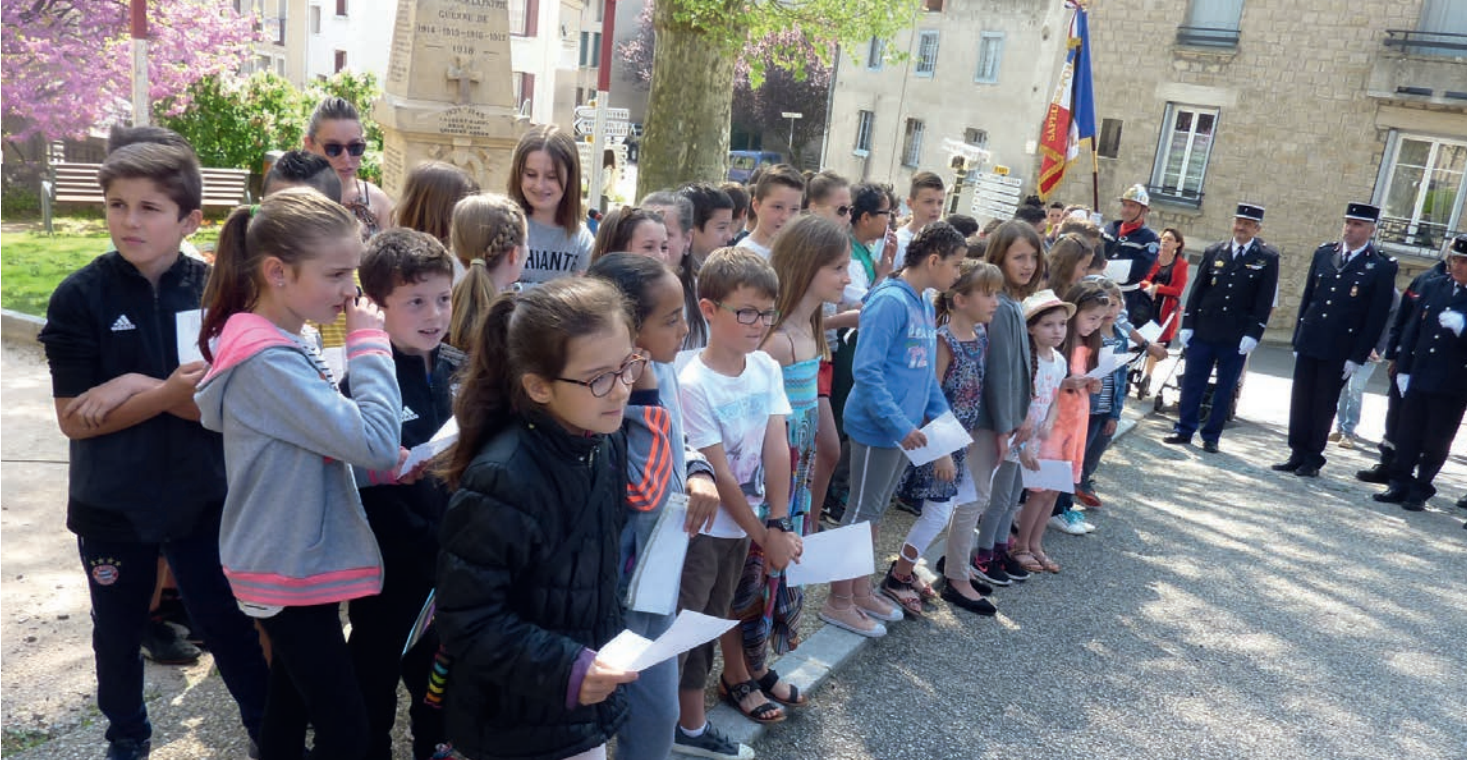
Le dimanche matin, les enfants des deux écoles sont venus chanter le chant des partisans au Monument aux Morts lors de la commémoration du 8 mai.