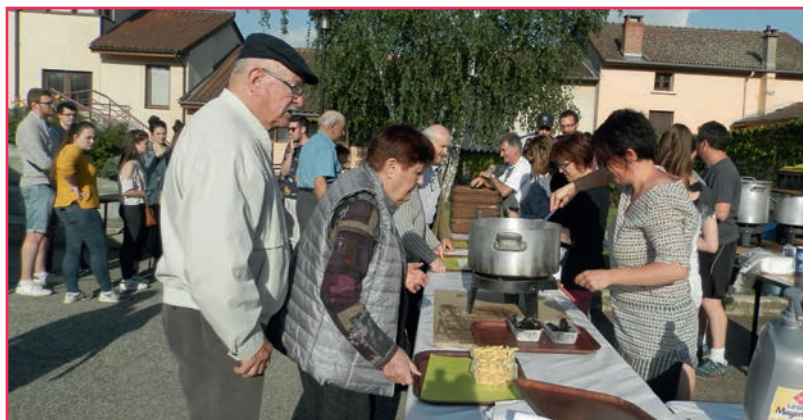
Cette belle fête se terminait par un repas moules-frites organisé par le basket et le foot accueillant de nombreux participants.