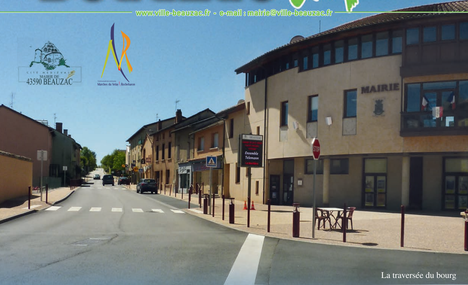
La traversée du bourg