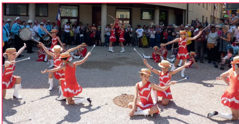
L'après-midi, la fanfare d'Épinouze et ses majorettes ainsi que la banda du Chambon-Feugerolles ont animé le bourg.