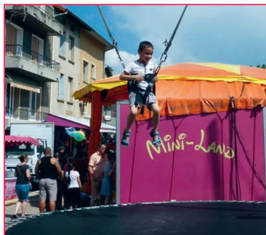
De nombreux manèges et attractions faisaient le bonheur des petits et des grands.