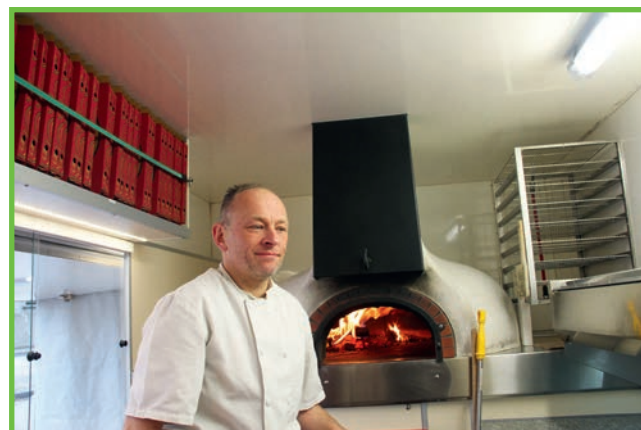
Le comptoir à pizzas