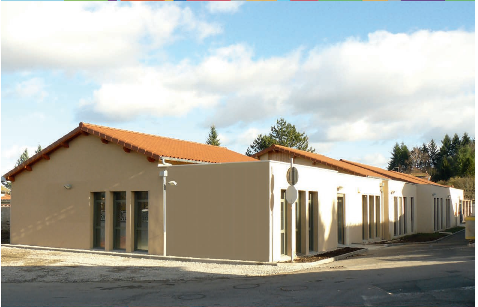
Extension du pôle médical

www.ville-beauzac.fr - e-mail : mairie@ville-beauzac.fr