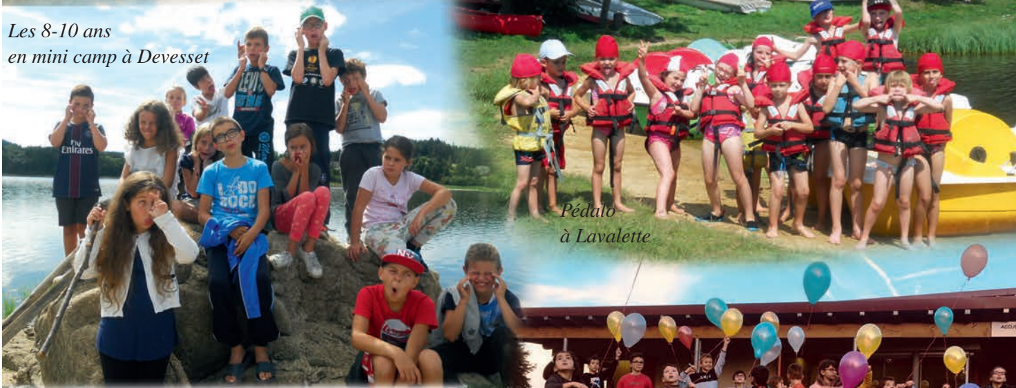
Pédalo à Lavalette