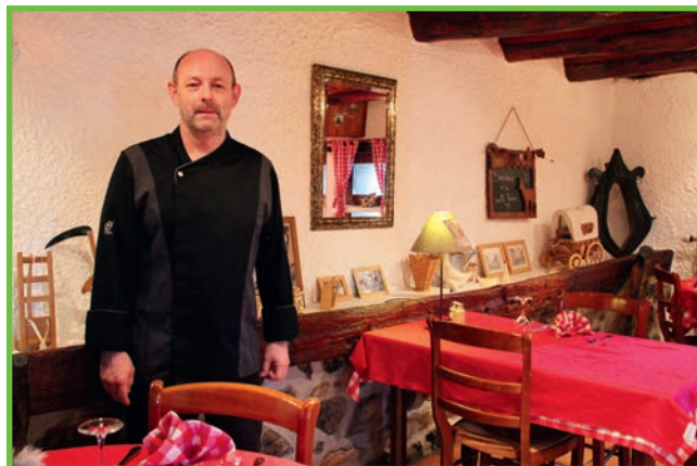
La vieille ferme

L'atelier By Sandy Caire dispense des cours de cuisine. Les repas réalisés sont partagés autour d'une table d'hôtes. Pizza Aux 4 Coins et Le Comptoir à Pizza cuisent pour l'heure souhaitée, les pizzas de votre choix.