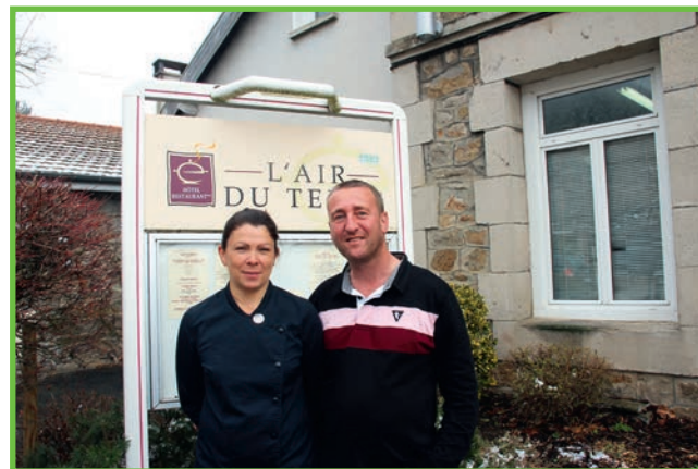
L'air du temps