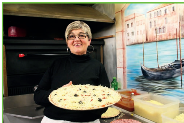
Pizzas aux 4 coins