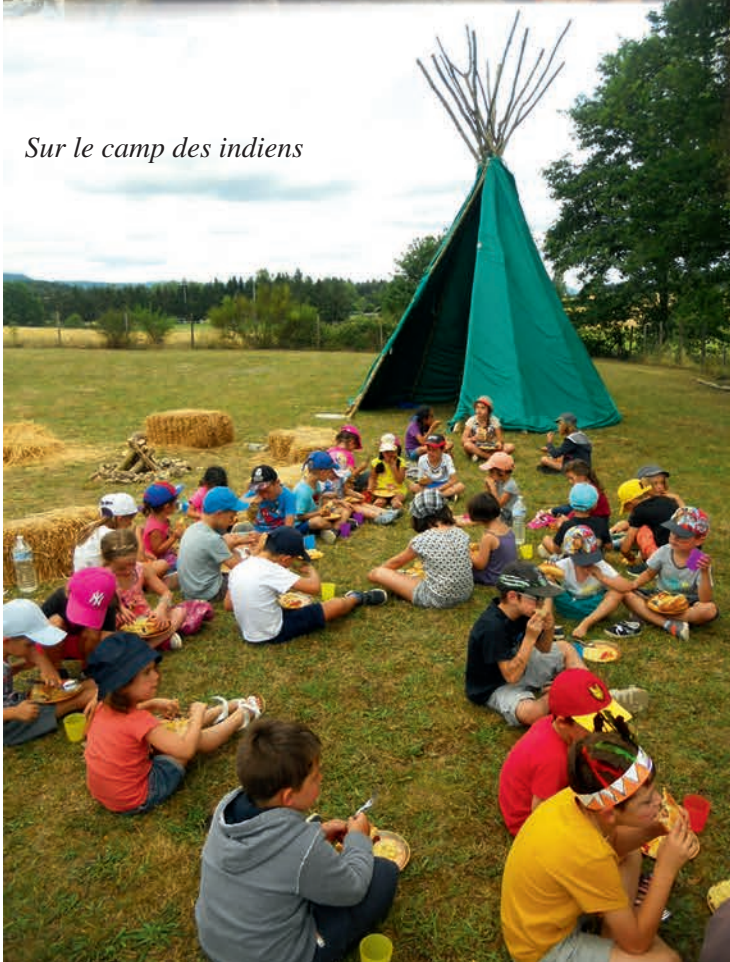
Sur le camp des indiens