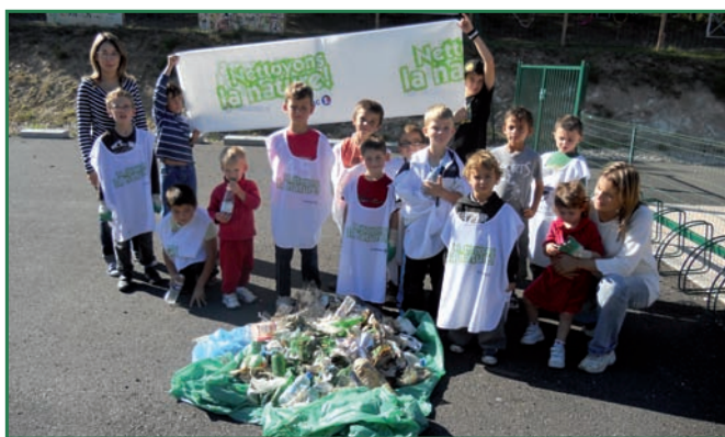
La garenne et ses trésors !!!

Equipés de gants et de chasubles, les enfants ont ratissé la Garenne, leur terrain de jeu favori. Bouteilles, verres pilés, papiers, mégots, capsules... autant de « trésors » que promeneurs ou fêtards oublient sur leur passage. Quel dommage !