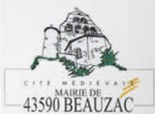
Place de l'église - bourg médiéval