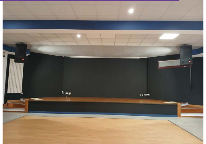
RAFRAICHISSEMENT SALLE DES REMPARTS