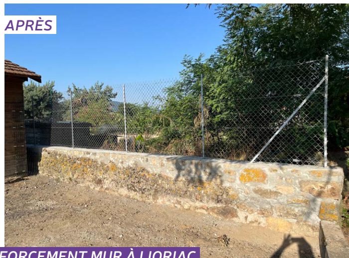
RENFORCEMENT MUR À LIORAC