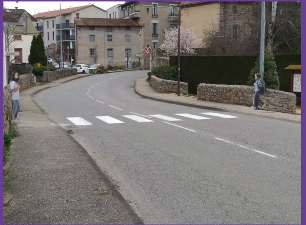
SÉCURISATION DES ABORDS DES ÉCOLES