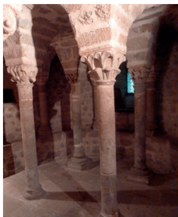
12 colonnes ( comme les 12 apôtres ?)

Légende: A : escaliers B : croisée C : niches ou loculi