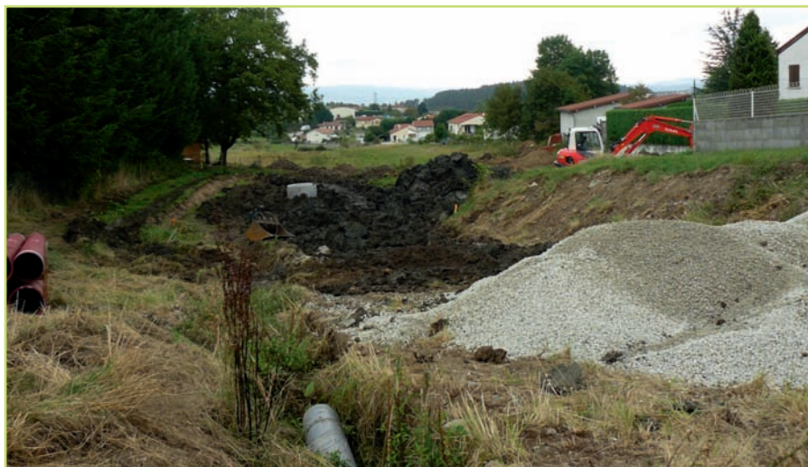
Bassin des Sausses

Les 2 bassins d'orage permettant de réguler l'eau pluviale dans le bourg lors de fortes pluies sont en chantier. Le premier, aux Sausses est bien avancé, quant à celui du Rousson les premiers coups de pelleuse ont été donnés. Ils nécessitent le déplacement du réseau d'égout sur la longueur des bassins. Si le temps reste clémente on peut espérer leur mise en service avant la fin de l'année.